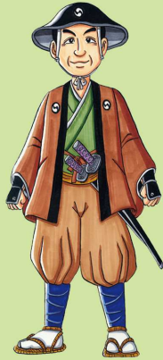
まんが/しげおか秀満